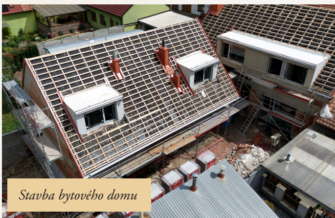
Stavba bytového domu