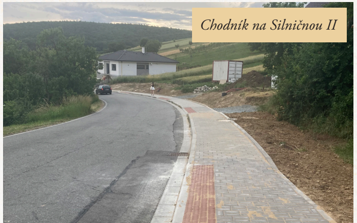
Chodník na Silničnou II