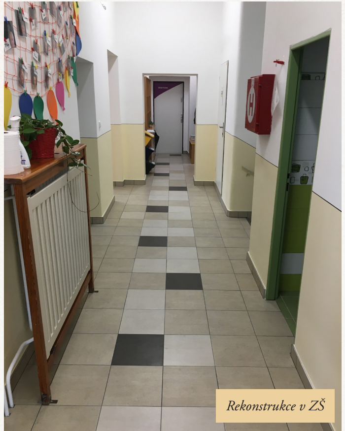
Rekonstrukce v ZŠ