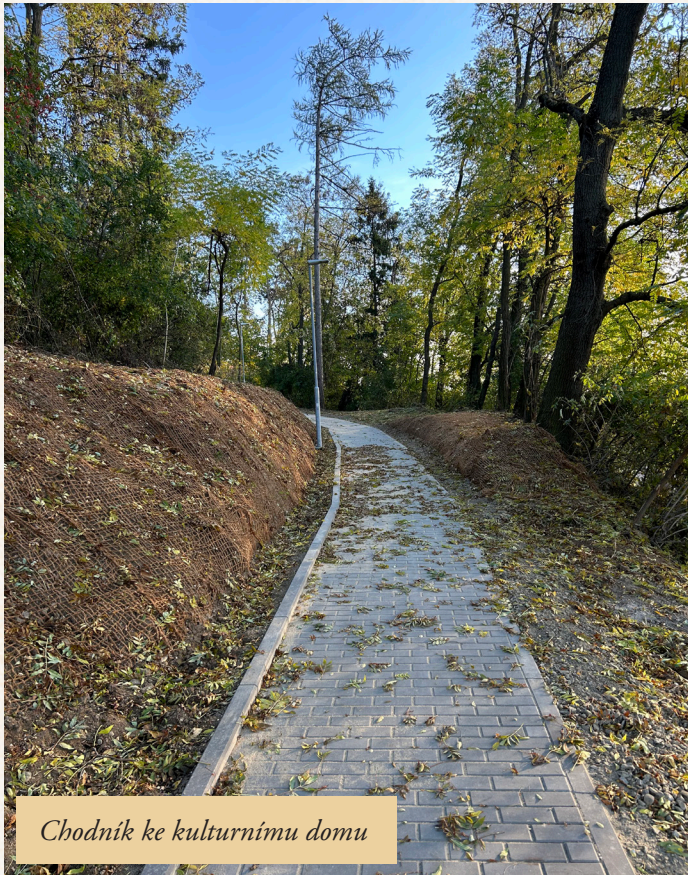
Chodník ke kulturnímu domu