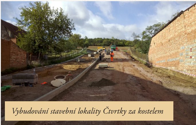
Vybudování stavební lokality Čtvrtky za kostelem