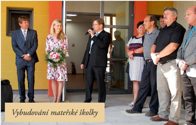
Vybudování mateřské školky