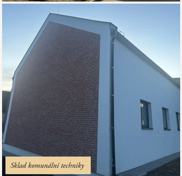
Sklad komunální techniky