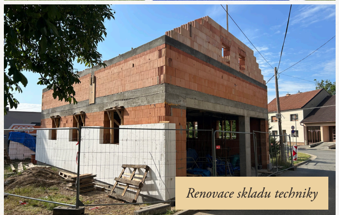
Renovace skladu techniky