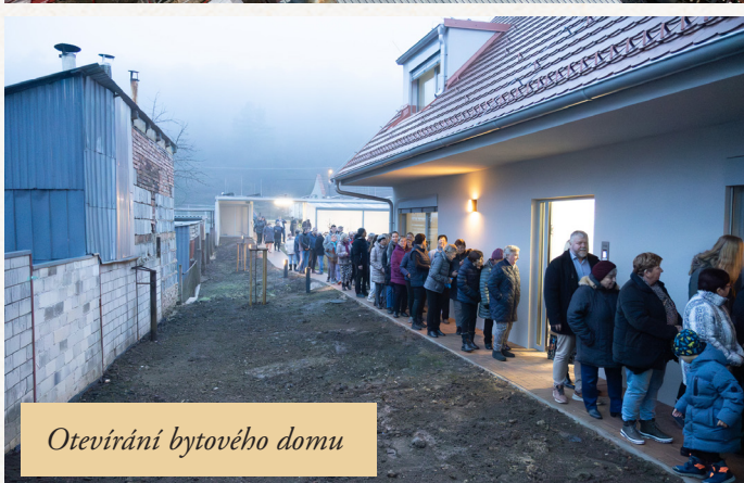
Otevírání bytového domu