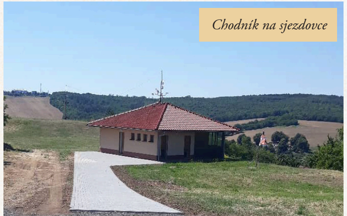
Chodník na sjezdovce